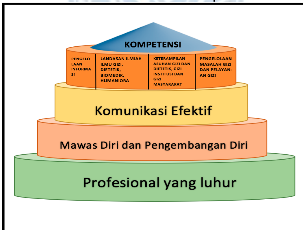
Gambar 2: Pondasi dan Pilar Kompetensi